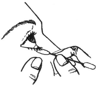
Het schoonpoetsen van de oogleden.

Maak per poetsbeurt ongeveer tien heen en weer gaande poetsbewegingen. Verwijder daarna de shampoo met een vochtige doek en dep hierna uw oogleden droog. Wanneer bovenstaande methode niet goed lukt, kunt u ook de ogen met een washand flink uitwassen bij licht gesloten oogleden.