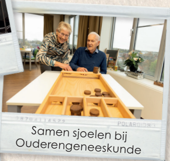
Samen sjoelen bij Ouderengeneeskunde