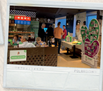
Kerstpresentje voor bedrijfsvrienden