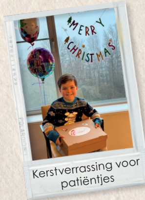
Kerstverrassing voor patiëntjes