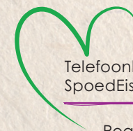
Telefoonkluisjes op de SpoedEisende Hulp