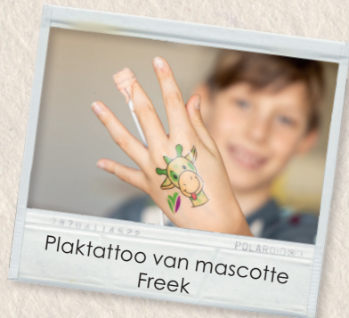
Plaktattoo van mascotte Freek