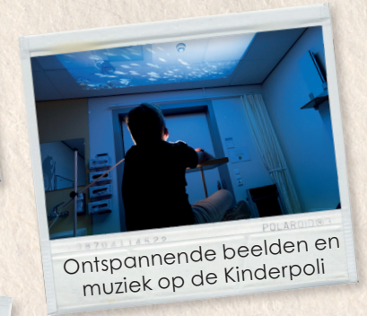
Ontspannende beelden en muziek op de Kinderpoli