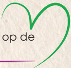
Kinderspeelgoed op de Dagbehandeling