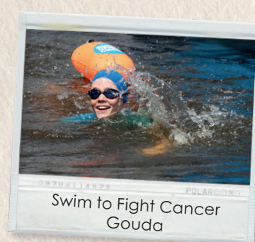
Swim to Fight Cancer Gouda