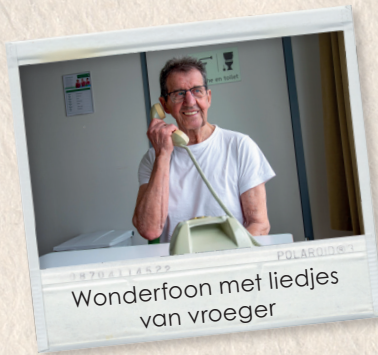
Wonderfoon met liedjes van vroeger