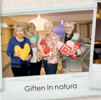
Giften in natura