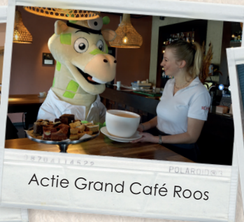
Actie Grand Café Roos