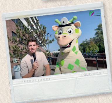
Zorgvriendenweek samen met de vriendenstichtingen van Nederlandse ziekenhuizen