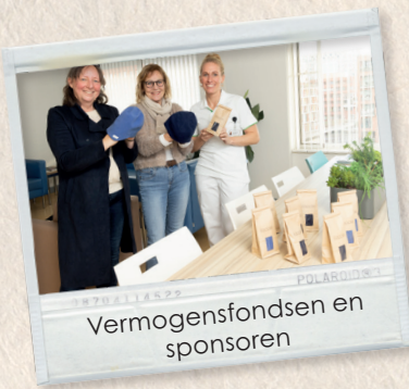
Vermogensfondsen en sponsoren