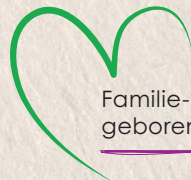
Familie-fotoshoots te vroeg geboren of zieke baby's