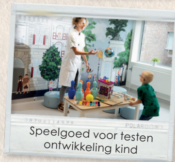
Speelgoed voor testen ontwikkeling kind