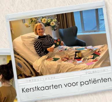
Kerstkaarten voor patiënten