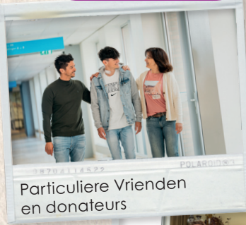
Particuliere Vrienden en donateurs