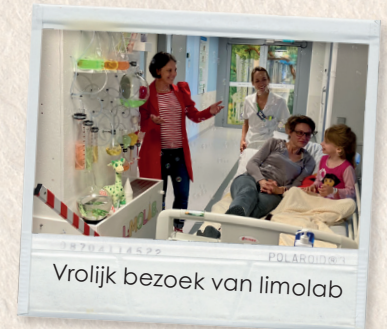
Vrolijk bezoek van limolab