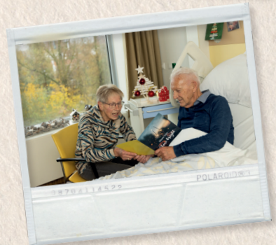
Eindejaarscampagne met kerstkaartjes voor patiënten