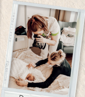
Donaties na familie-fotoshoots