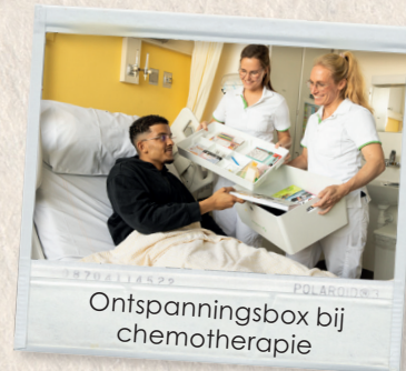
Ontspanningsbox bij chemotherapie