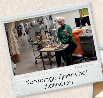
Kerstbingo tijdens het dialyseren