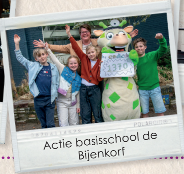
Actie basisschool de Bijenkorf