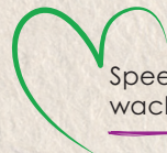
Speeltorens in de wachruimtes