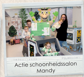
Actie schoonheidssalon Mandy