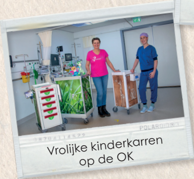
Vrolijke kinderkarren op de OK