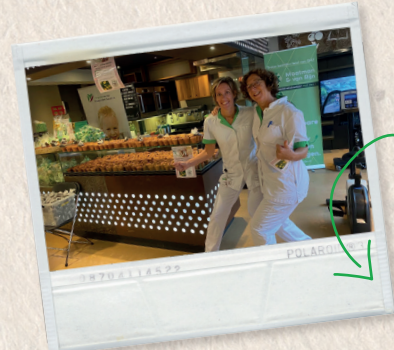
Open dag GHZ met vriendenontbijt, acties en knuffelen met mascotte Freek