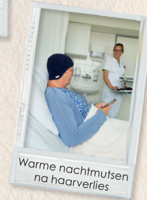
Warme nachtmutsen na haarverlies