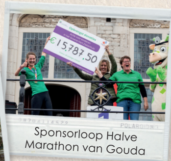
Sponsorloop Halve Marathon van Gouda