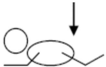
druk geven op de billen